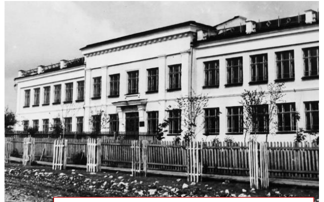
Здание Исовской семилетней школы, где начались занятия первой группы вечернего дренажно-гидравлического горного техникума.

Так что, ждём вас, новое пополнение! Надеемся, что вы станете достойными студентами ИГРТ!