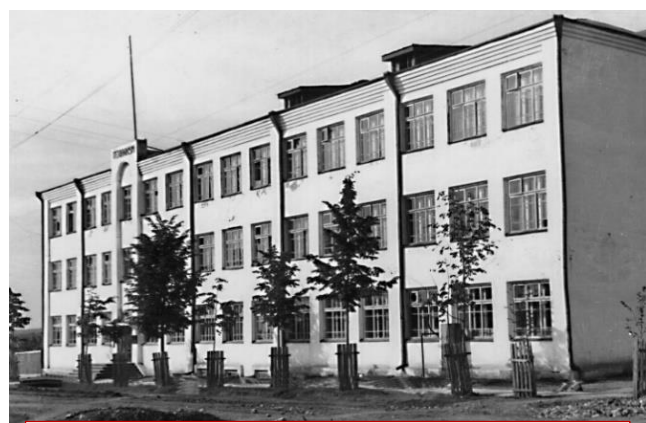
Первое здание техникума в пос. Ис

Послевоенной стране очень нужны специалисты для разведки и добычи полезных ископаемых. В то время в наш техникум молодежь ехала со всех краёв Советского Союза. Экзамены – на конкурсной основе, на место – 10-12 человек.