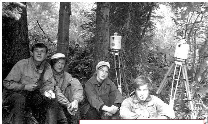
ИГРТ. Геофизики 60-х.

Освоение Земли немислимо без проведения географических наблюдений – замеров расстояний, вычисления движения океанов и морей, описания особенностей протекания чрезвычайных ситуаций и природных катаклизмов. В современном обществе высоко ценится труд геофизика – открытия этих людей способны изменить представления человечества о жизни в целом.